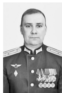
Герой Российской Федерации Абраменко Михаил Владимирович, 31 августа 1978 – 4 декабря 2022 гг., г. Дербент

За мужество, проявленное при выполнении боевых задач, Э. Набиев Указом Президента России от 1 сентября 2022 года удостоен высокого звания Героя РФ.