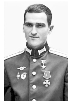
Герой Российской Федерации Абуталимов Темирлан Умарович, 2 мая 1997 г., с. Темираул, Хасавюртовский район

11 марта 2023 года Указом В. Путина за героизм, проявленный при исполнении воинского долга, удостоен посмертно звания Героя РФ.