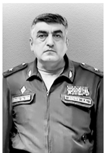
Герой Российской Федерации Абачев Эседулла Абдумунинович, 13 июня 1968 г., с. Зильдик, Хивский район

Указом Президента России В. В. Путина от 3 марта 2022 года за «мужество и героизм, проявленные при исполнении воинского долга» удостоен звания Героя Российской Федерации (посмертно).