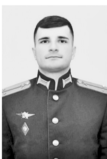
Герой Российской Федерации Магомедов Шамиль Набибуллагович, 19 ноября 1991 – 9 сентября 2022 гг., с. Уркарах, Дахадаевский район

За мужество и героизм, проявленные при выполнении боевых задач СВО на Украине, И. Магомедов Указом Президента России от 14 декабря 2022 года удостоен посмертно звания Героя РФ.