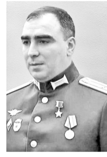
Герой Российской Федерации Набиев Энвер Альбертович, 3 февраля 1988 г., г. Каспийск

За мужество и героизм, проявленные при выполнении боевых задач, Р. Курбанов Указом Президента России от 10 сентября 2022 года был удостоен высокого звания Героя Российской Федерации.