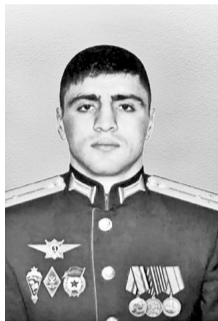
Герой Российской Федерации Гаджимагомедов Нурмагомед Энгельсович, 29 сентября 1996 – 25 февраля 2022 гг., с. Кани, Кулинский район

Отмечая героизм молодого дагестанца, Президент страны заявил, что гордится быть частью могучего многонационального народа России: «Я русский человек, и, как говорится, у меня в роду кругом Иваны да Марьи. Но когда я вижу примеры такого героизма, как подвиг молодого парня Нурмагомеда – уроженца Дагестана, лацка по национальности, других наших воинов, мне хочется сказать: «Я лакец, я дагестанец, я чеченец, ингуш, русский, татарин, еврей, мордвин, осетин...» Всех – более чем трехсот национальных и этнических групп России – просто невозможно перечислить!.. Горжусь тем, что я есть часть этого мира, часть могучего, сильного, многонационального народа России. Вместе с тем никогда не откажусь и от своего убеждения, что русские и украинцы – это один народ».