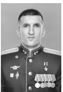
Герой Российской Федерации Курбанов Руслан Маркизович, 10 декабря 1996 г., с. Татиль, Табасаранский район

За мужество, проявленное при исполнении воинского долга, Ш. Магомедов Указом В. Путина от 14 апреля 2023 года удостоен посмертно звания Героя РФ.