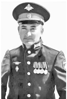
Герой Российской Федерации Магомедов Исрафил Летифович, 20 декабря 1981 – 15 октября 2022 гг., г. Дагестанские Огни

За мужество и героизм, проявленные при исполнении воинского долга, 4 июля 2022 года Владимир Путин подписал Указ о присвоении Э. Абачеву Героя Российской Федерации.