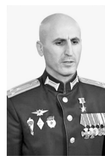
Герой Российской Федерации Умаев Залибек Касумович, 25 мая 1980 г., с. Уллубийаул, Карабудахкентский район

За мужество и стойкость, проявленные при выполнении боевых задач, Т. Абуталимов Указом Президента России от 10 ноября 2023 года удостоен высокого звания Героя Российской Федерации.