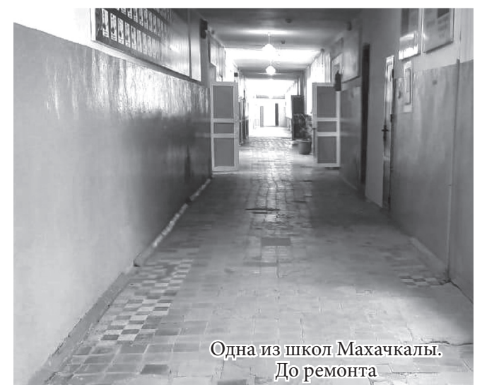
Одна из школ Махачкалы. До ремонта