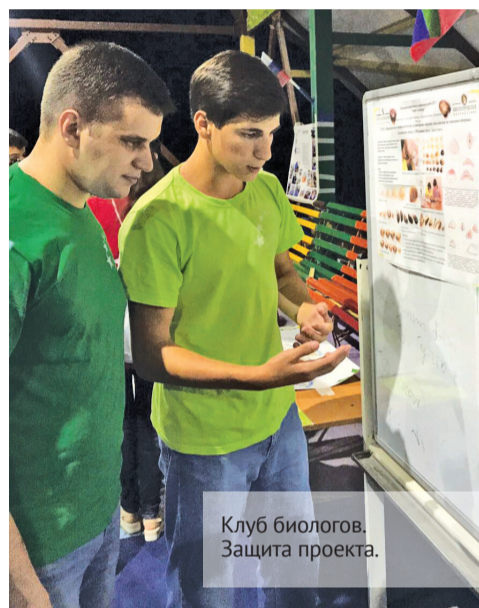
Клуб биологов. Защита проекта.

В рамках смены участники разработают проекты, которые представят к защите на итоговой конференции. Смена завершилась яркой презентацией проектов. На протяжении трех недель ребята с увлечением занимались по 10 направлениям. Инженеры собирали экспериментальные установки, экологи изучали состав воды из артезианских скважин, информатики писали программы, СММщики снимали видеоролики и кино.