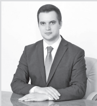
А. В. КАРПУХИН, заместитель министра образования и науки Республики Дагестан

Федеральный Закон от 29 декабря 2012 года № 273-ФЗ «Об образовании в Российской Федерации» предоставил новые возможности для организации учебного процесса с целью повышения качества знаний. Вместе со свободой в формировании основной образовательной программы в школе, он наделил образовательные организации и ответственностью за самостоятельно принимаемые решения.