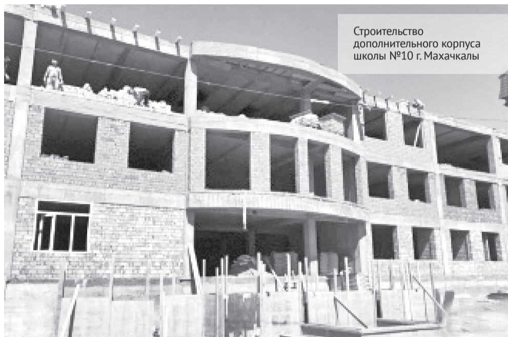
Строительство дополнительного корпуса школы №10 г. Махачкалы

В Махачкале уже открыты две такие семейные группы, а к 1 сентября планируется открытие еще нескольких групп.