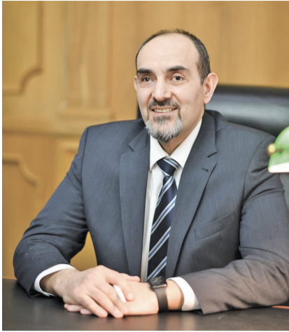
Продолжение. Начало см. на стр. 1

Продолжается сбор документов, оформление заявки для участия в республике в конкурсном отборе 2-й очереди 2-го этапа. Если правительство республики окажет поддержку в плане финансирования выделяемых федеральным центром средств, мы намерены принять участие в конкурсе. В случае успеха это позволит охватить еще порядка 40 организаций.