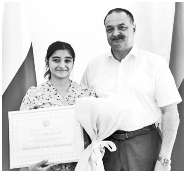
Встреча Главы РД С. Меликова со стобалльниками и одаренными детьми. Церемония награждения

• усилить работу по вовлечению обучающихся общеобразовательных организаций в профориентационные мероприятия, в том числе организация прохождения ими профессиональных проб на базе профессиональных образовательных организаций.