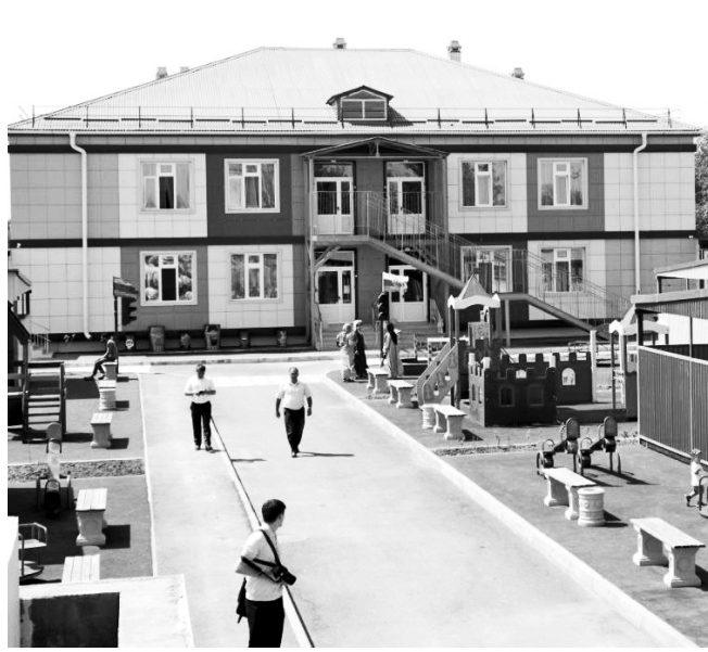
Новый детский сад "Родничок" на 200 мест в с. Нецаевка Кизилюртского района