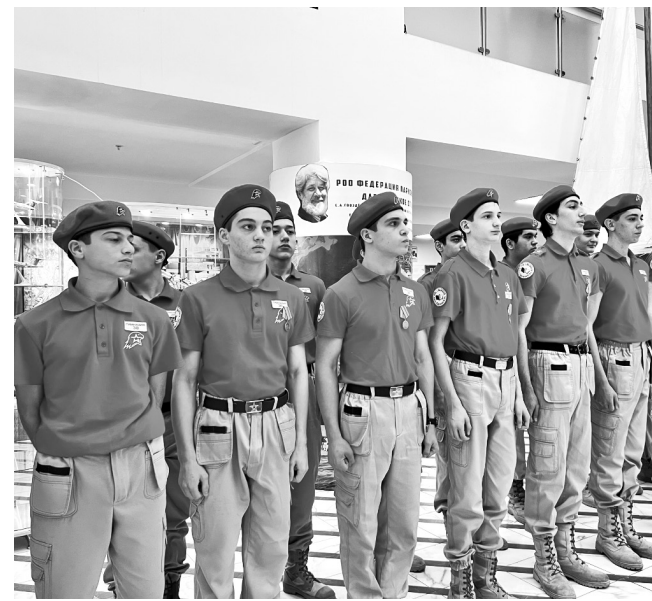
Махачкала. Исторический парк "Россия – моя история". Награждение юнармейцев – участников Парада Памяти в Самаре