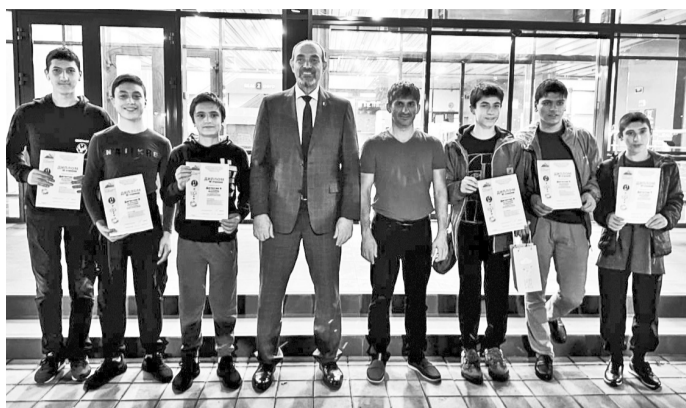
математическим центром Адыгейского государственного университета, Республиканской естественно-математической школой в целях выявления одаренных детей-математиков.

Отметим, турнир проводился ВДЦ «Орленок», Кавказским